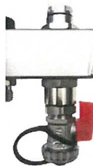
Purmo Modul Andstycke

Golvvärmefördelaren består av ett tilllopps- och ett returrör. På tillloppsröret sitter flödesmätare för instrypning av respektive slinga. Instrypningen görs för att alla slingor skall vara balanserade och få jämn tillförsel av värme. Injustering av flödesmätare utförs med medföljande ratt genom att vrida flödesmätaren tills korrekt flödesvärde erhålls. Injustering av fördelare görs enligt de beräknade flöden som erhålls tillsammans med ritningen av anläggningen. På dessa tilllopp- och returrör sitter påfyllningsventil och avluftning.