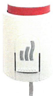
Ställdon öppet för uppvärmning